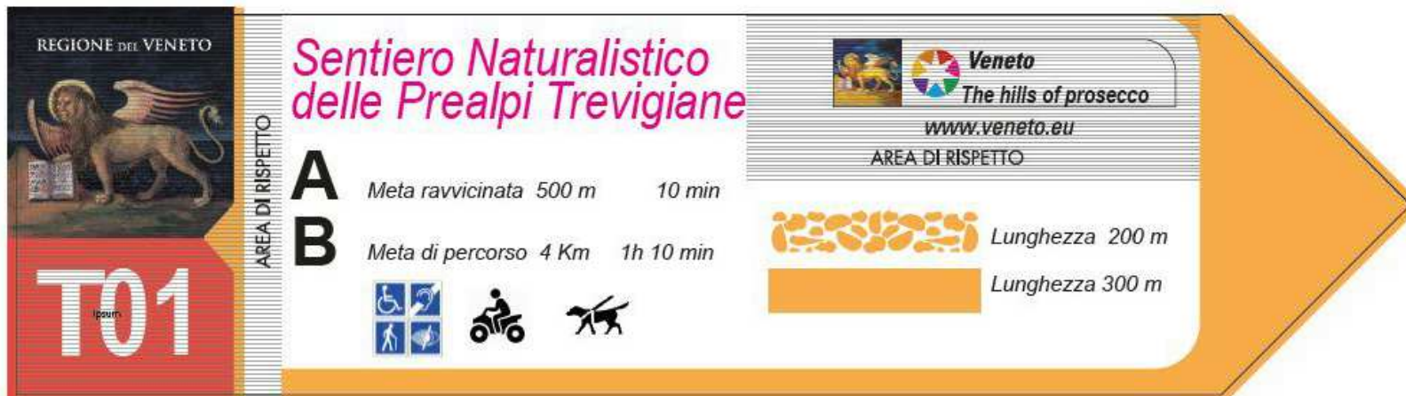
esempio di cartellonistica inclusiva