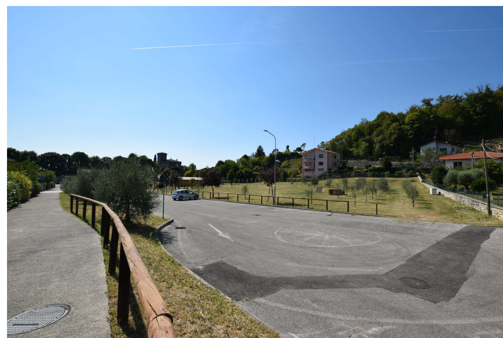
TARZO - Parco Broli