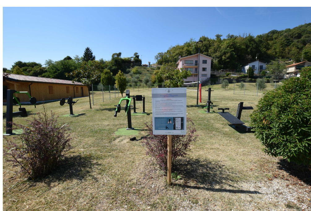
esempio di parco inclusivo